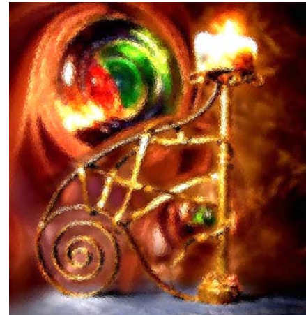
Composición: "Vida y Sensación Sublime". Autor: Denise Morales

Fase de Valoración: es el proceso de aceptación del producto creativo terminado dentro de un contexto científico, educativo, social, productivo, político; y esto se logra a través de la comunicación.